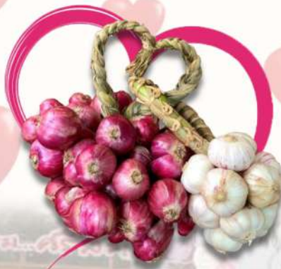
ชุดหอมแดงและกระเทียมประมาณ 3 กก. ราคา 467 บาท/กล่อง (ชุด)

สนใจสั่งซื้อผ่าน Line Official เพียงสแกนคิวอาร์โค้ด ID LINE : @997ymzqe ลิงค์ : https://lin.ee/yGRFKIX หรือ ทาง Facebook Fan page : สำนักงานพาณิชย์จังหวัดศรีสะเกษ ตั้งแต่บัดนี้เป็นต้นไป