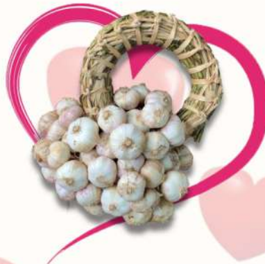
ชุดกระเทียมขนาดประมาณ 3 กก. ราคา 527 บาท/กล่อง (ชุด)