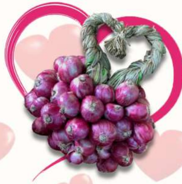
ชุดหอมแดงขนาดประมาณ 3 กก. ราคา 230 บาท/กล่อง (ชุด)

จำหน่ายหอมแดงและกระเทียม GI เกรด A ใส่ในถุงตาข่าย ถุงละประมาณ 1 กก. พร้อมป้ายข้อความอวยพร ขนาดบรรจุ กว้าง กว้างละ 3 ถุง (ประมาณ 3 กก.) ราคารวมค่าจัดส่งฟรี!!