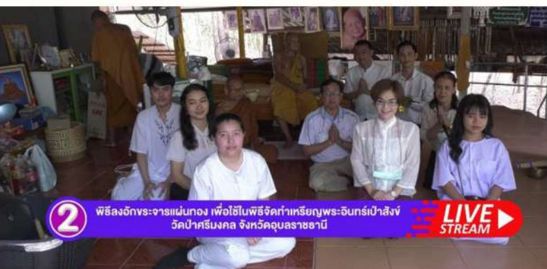
2 พิธีลงอักขระจารแม่ทอง เพื่อใช้ในพิธีจัดทำเหรียญพระอินทร์เป่าสังข์ วัดป่าศรีมงคล จังหวัดอุบลราชธานี LIVE STREAM