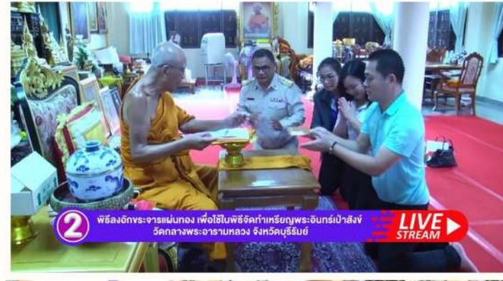
2 พิธีลงอักขระจารแม่ทอง เพื่อใช้ในพิธีจัดทำเหรียญพระอินทร์เป่าสังข์ วัดกลางพระอารามหลวง จังหวัดสุรินทร์ LIVE STREAM