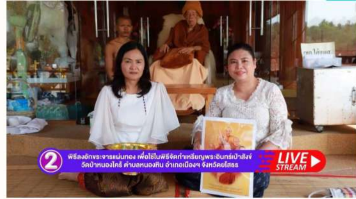
2 พิธีลงอักขระจารแม่ทอง เพื่อใช้ในพิธีจัดทำเหรียญพระอินทร์เป่าสังข์ วัดป่าหนองไทร ตำบลหนองหิน อำเภอเมืองฯ จังหวัดยโสธร LIVE STREAM