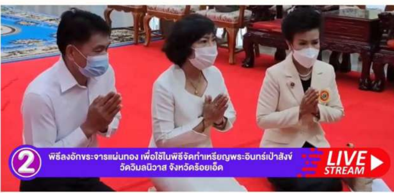
2 พิธีลงอักขระจารแม่ทอง เพื่อใช้ในพิธีจัดทำเหรียญพระอินทร์เป่าสังข์ วัดจิมลนิवास จังหวัดร้อยเอ็ด LIVE STREAM