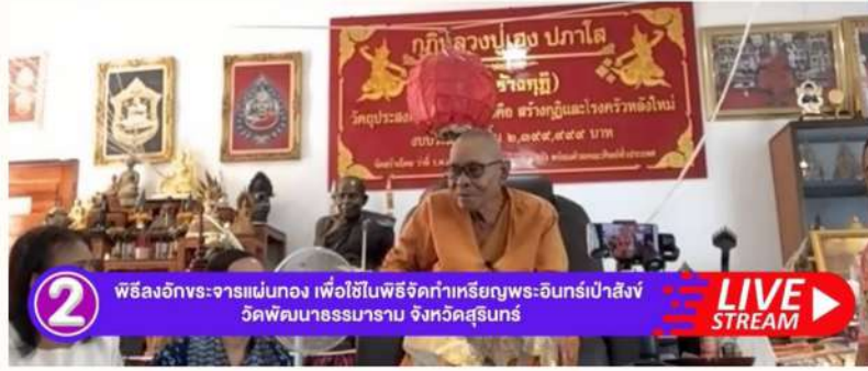
2 พิธีลงอักขระจารแม่ทอง เพื่อใช้ในพิธีจัดทำเหรียญพระอินทร์เป่าสังข์ วัดพัฒนารธรรมาราม จังหวัดสุรินทร์ LIVE STREAM