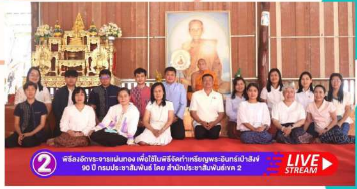
2 พิธีลงอักขระจารแม่ทอง เพื่อใช้ในพิธีจัดทำเหรียญพระอินทร์เป่าสังข์ 90 ปี กรมประชาสัมพันธ์ โดย สำนักประชาสัมพันธ์ 2 LIVE STREAM

ทั้งหมดนี้ก็จะนำมารวบรวมมวลสารและแผ่นทองคำ มาที่กรุงเทพมหานคร เพื่อใช้ในการจัดสร้างพระอินทร์เป่าสังข์ ในวันสำคัญอีกคือวันที่ 3 พฤษภาคม 2566 วันครบรอบ 90 ปี กรมประชาสัมพันธ์ จะนำเหรียญทั้งหมดนี้มาเข้าพิธีพุทธา ภิเษกที่กรมประชาสัมพันธ์อีกครั้งหนึ่ง เพื่อให้ทุกคนได้มีส่วน ร่วมในพิธี และรับเหรียญกลับไปบูชาเป็นสิ่งยึดเหนี่ยวจิตใจ ประจำตัวต่อไป ทั้งหมดนี้คือที่มาของการจัดสร้างพระอินทร์ เป่าสังข์ ในโอกาสครบรอบ 90 ปี กรมประชาสัมพันธ์ ที่เป็น โอกาสสำคัญและเป็นมงคลยิ่งของชาวกรมประชาสัมพันธ์