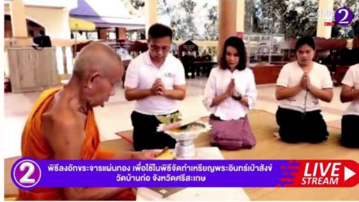
2 พิธีลงอักขระจารแม่ทอง เพื่อใช้ในพิธีจัดทำเหรียญพระอินทร์เป่าสังข์ วัดบ้านก่อ จังหวัดศรีสะเกษ LIVE STREAM